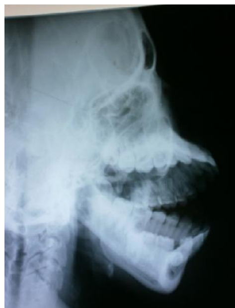
Figure 1 : Radiographie du crâne de profil droit montrant la dent surnuméraire et son kyste péri coronaire au niveau parasymphysaire droit.

Les suites opératoires sont bonnes. L'anatomie pathologie du sac péri coronaire est en faveur d'un kyste dentigère.