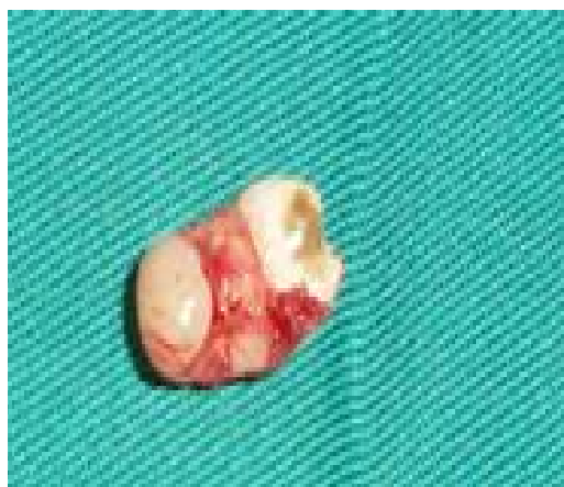
Figure 3 : Dent surnuméraire extraite