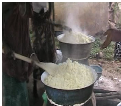
Photo 5 : Des restauratrices en plein préparation de l'attiéké, mets très prisé durant les festivités de « Mafa »

La quasi-totalité des tenanciers de commerces et transporteurs enquêtés sont unanimes pour reconnaître que chaque fois qu'il y a excursion, ils n'ont enregistré que des bénéfices. Mais ils se gardent de révéler les montants de leur chiffres d'affaires à cause du caractère informel dans lequel ils travaillent puisqu'ils ne payent aucune taxe. On note d'ailleurs, une certaine susceptibilité de leur part due à l'idée que l'on voudrait savoir leurs gains pour envisager de leur imposer des taxes exorbitantes à payer aux organisateurs de la cérémonie, notamment, le bureau de la jeunesse et la chefferie.