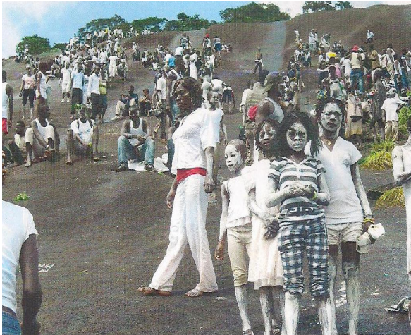
Photo 4 : Des excursionnistes badigeonnés de caolin blanc sur les « Mafa »

La cérémonie traditionnelle d'adoration des « Mafa » se mue progressivement en une activité à caractère touristique. Cette dimension touristique se manifeste par un afflux de personnes dans le village chaque année dans le mois de Septembre, période durant laquelle s'effectue l'excursion sur les « Mafa » ouverte à tous, dans une ambiance festive.