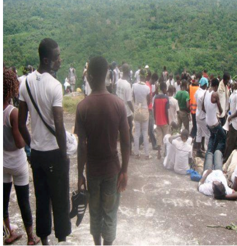
Photo 6 : Sur les « Mafa » : lieu de rencontre et d'échange entre des participants

Mais, une autre réalité qui découle de cette dimension touristique qu'a prise la célébration des « Mafa » est relative, à la mutation progressive qui s'observe dans les pratiques et principes traditionnelles inhérents à l'adoration de ce patrimoine ancestral.