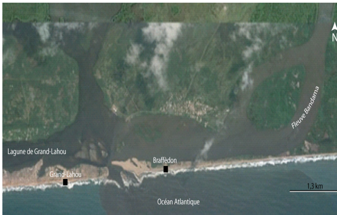
Figure 2 : Localisation sur la façade atlantique du site initial de la ville de Grand-Lahou (Google, 2014)

et l'administration a abandonné les bâtisses les plus proches du front de mer (Kipré, 1985 ; Tapé, 2004). Les autorités coloniales semblaient impuissantes devant la fragilité du trait de côte qui ralentissaient les activités portuaires.