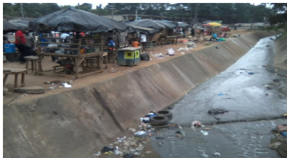
Photo 2 : Vue du décor d'exercice du petit commerce au carrefour Zoo.

L'insalubrité de l'espace commercial est la première forme de requalification du tronçon routier. En effet, les nombreuses activités commerciales qui se déroulent surtout aux quatre grands carrefours se font dans un décor d'insalubrité (cf. photo 2). Cette insalubrité détériore le paysage, favorise l'émergence d'une pollution tant atmosphérique avec les odeurs nauséabondes émanant des canaux d'évacuation, de drainage des eaux de ménage à proximité des étals que sonore (avec des bruits incessants émis par les commerçants et leurs clients), auxquels s'ajoutent les klaxons des véhicules et d'autres engins. Selon l'Anasur et les services techniques des mairies d'Abobo et d'Adjamé, ce sont environ 200 kg de déchets produits quotidiennement par ces commerçants. Cette insalubrité s'amplifie avec l'absence de civisme des acteurs et usagers qui foulent au pied les règles élémentaires d'hygiène (déversement des ordures près des étals, urinoirs naturels).