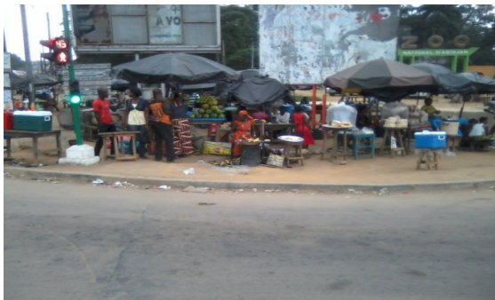
Photo 3 : Vue des installations anarchiques de commerçants au carrefour zoo.

Cet espace, qui n'est pas destiné au commerce est illégalement occupé par les activités du petit com-