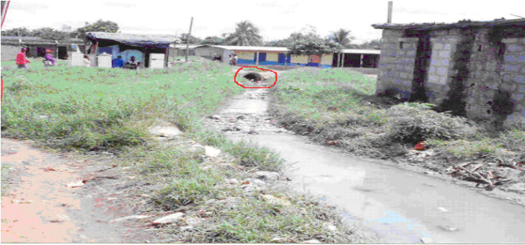
Photo 2 : Vue d'un tuyau de canalisation défectueux dans le quartier Doukouré

Le déficit d'assainissement s'observe également au niveau de la gestion des déchets solides. L'inaccessibilité des quartiers rend difficile, voire impossible, le ramassage des ordures ménagères par les structures en charge de la collecte des ordures.