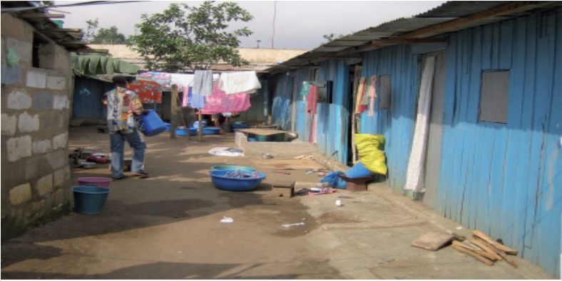
Condition de vie d'un déplacé (PDI) à Abidjan.